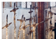
Skader/sår og forbindinger 14 kors af Günther Uecker