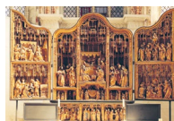
Marietiden-kapellet med Antwerpen alteret