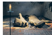
Klokkekapellet Nagelkreuz mindesmærket