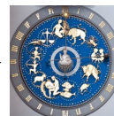
Det astronomiske ur