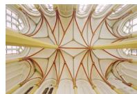
Brief-kapellet med Scheiter vinduer